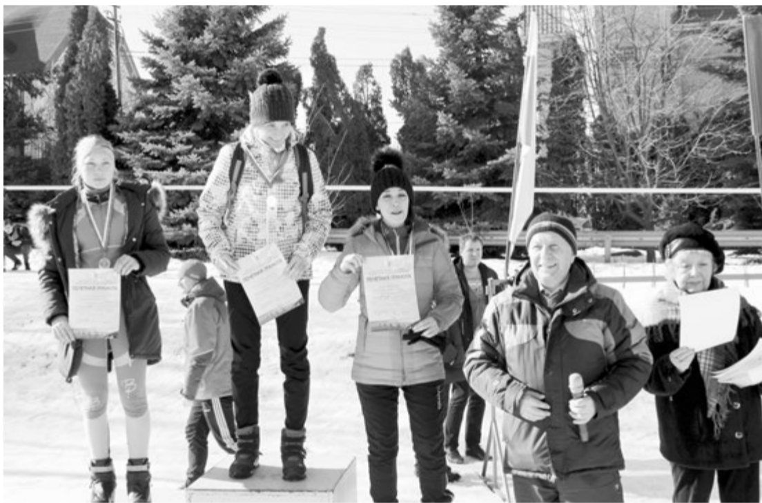
На пьедестале почета

молодых. И победила, завоевав главный приз - красивый, вкусный пирог с надписью «Победа».