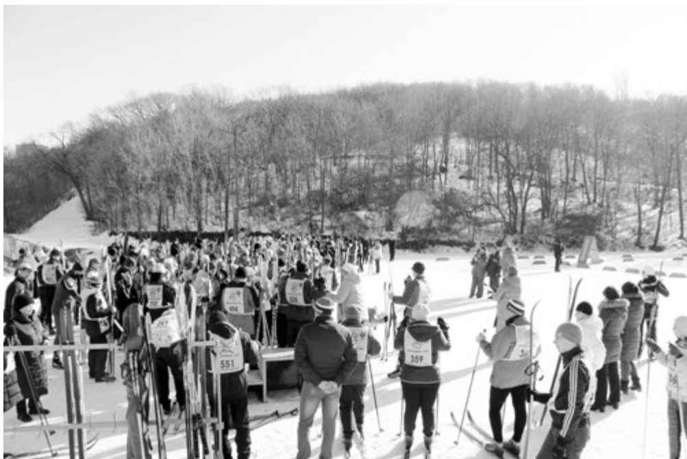
Профсоюзная лыжня на стадионе «Зимний»