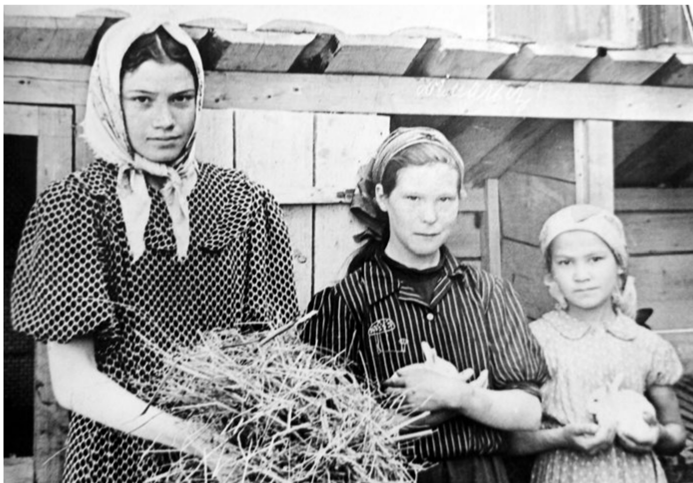
На школьной кролиководческой ферме